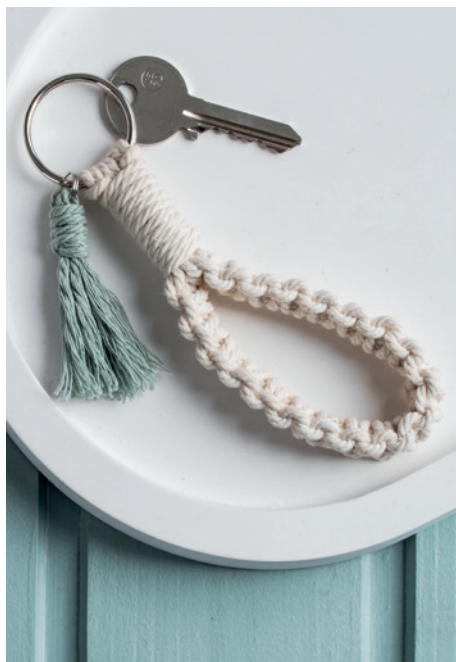
Noeud de tête d'alouette

6 En dernière étape, il faut raccourcir les fils à la longueur souhaitée, puis les fendre à l'aide d'une aiguille.