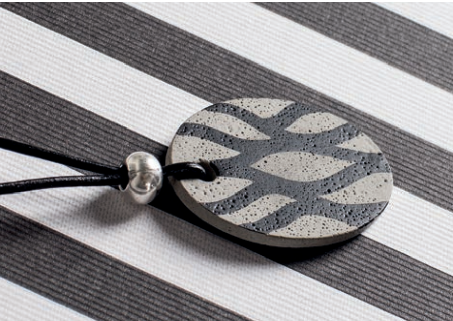
Réf. 8301802 + 35007102 ↑