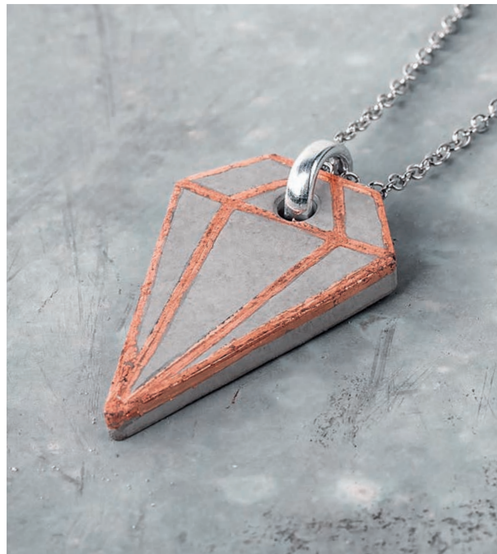
Réf. 2171524 ↗