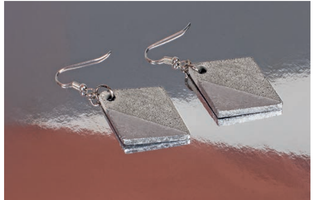
Réf. 2171522 ↗

Le béton se marie aussi bien avec de l'argent (p. ex. Rayher Déco Métal et des accessoires assortis). Parfait pour tous ceux qui préfèrent l'élégance discrète.