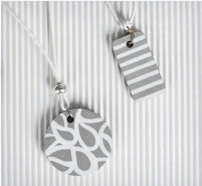
Réf. 8301801 + 35007576 ↓