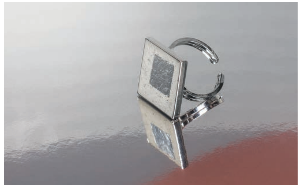
↓ Réf. 2235622