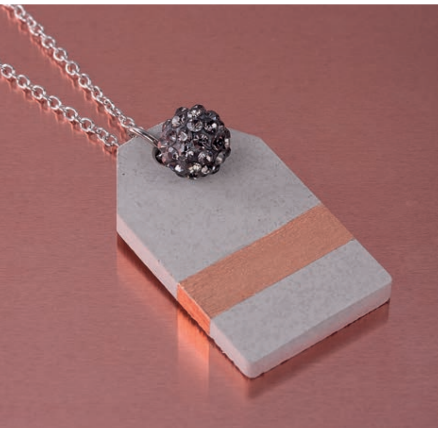
Réf. 2227622 ↑