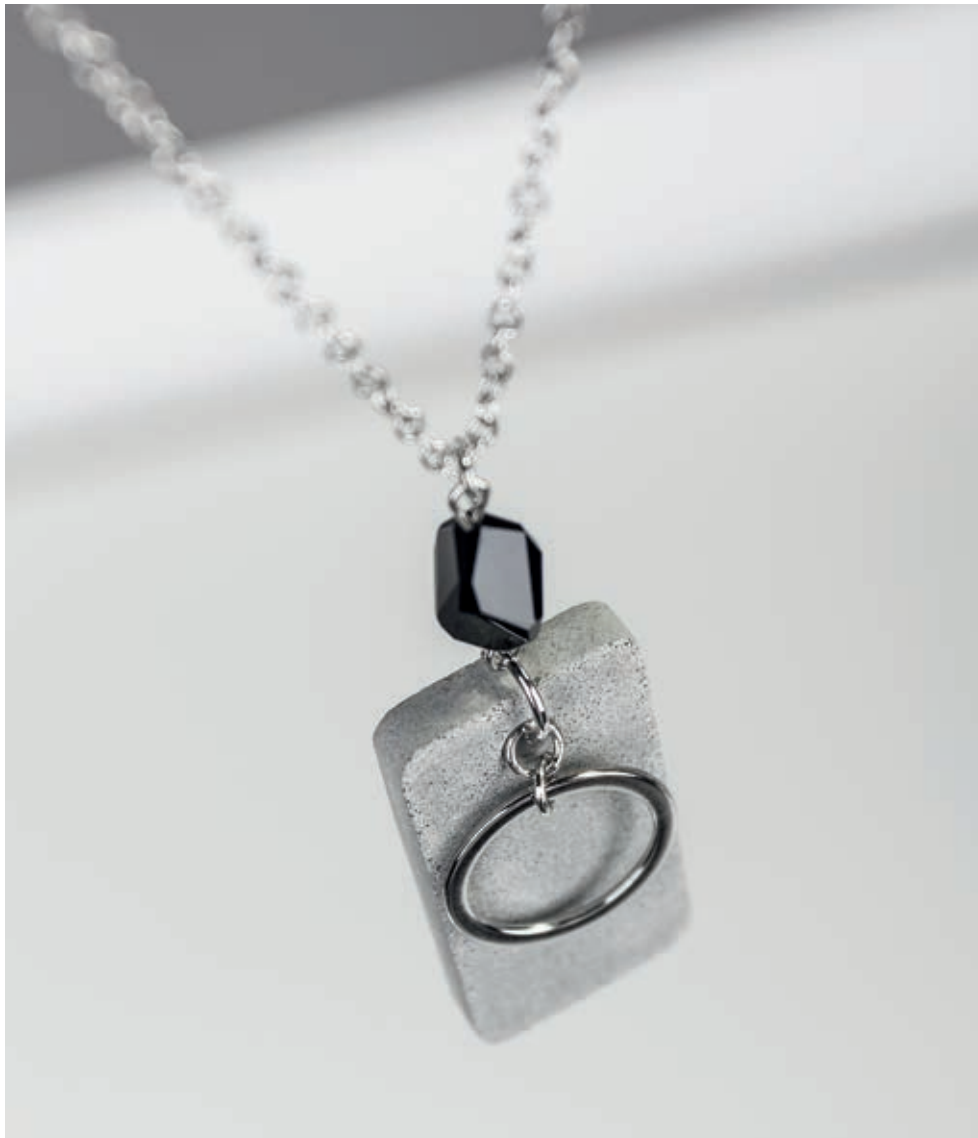
↳ Réf. 14787574