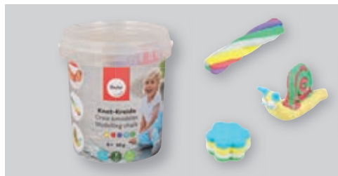
↑ 34462 000 Craie à modeler 6x125g