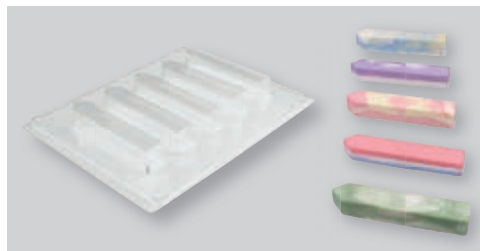
↑ 36111 000 Moule: Craie de trottoir