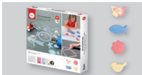
↑ 34466 000 DIY Kit Craie de trottoir