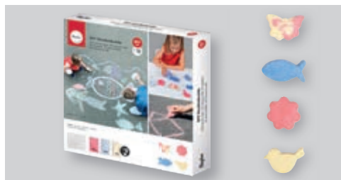
↑ 34466000 DIY Bastelpackung Straßenkreide