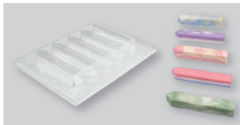
↑ 36111000 Gießform: Straßenmalkreide