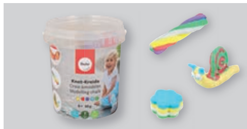
↑ 34462000 Knet-Kreide 6x125g