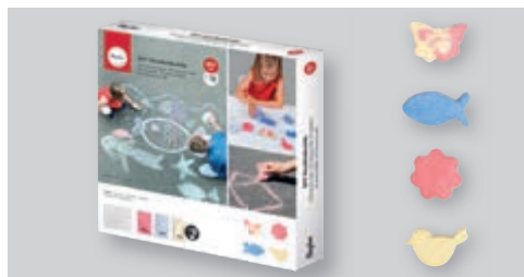
↑ 34466 000 DIY Bastelpackung Straßenkreide