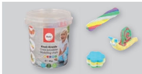
↑ 34462 000 Knet-Kreide 6x125g