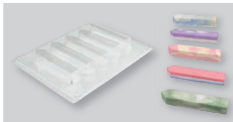
↑ 36111 000 Gießform: Straßenmalkreide