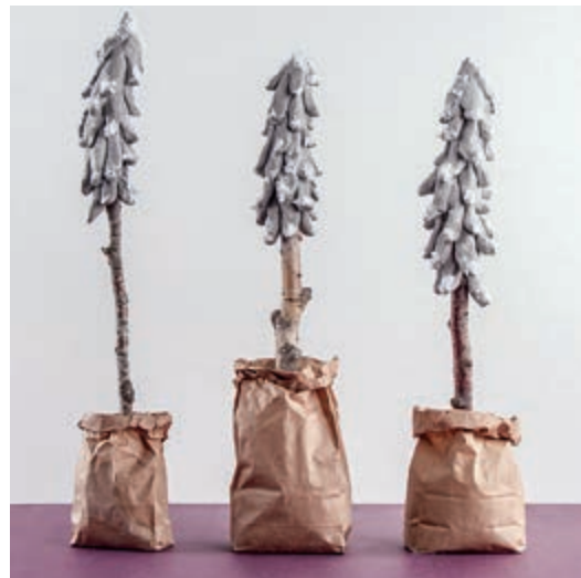
← Art. 3309600

Tipp: Für Vollformen kannst du einfach Styroporformen als Basis nehmen und diese ummanteln. So wird eine Deko-Kugel schön rund oder ein Vogel erhält seine Form.