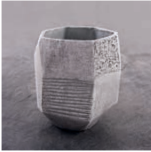
↑ Kreativ-Beton Paste (34202000)