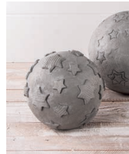
← Art. 14796999