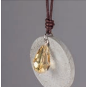
↑ Schmuck-Beton (34166000)