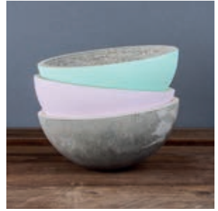
↑ Kreativ-Beton (z. B. 34152000)