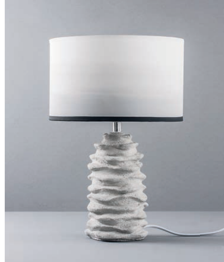
↑ Art. 23088000