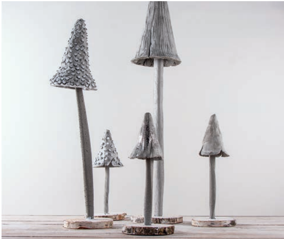
↑ Art. 3300900