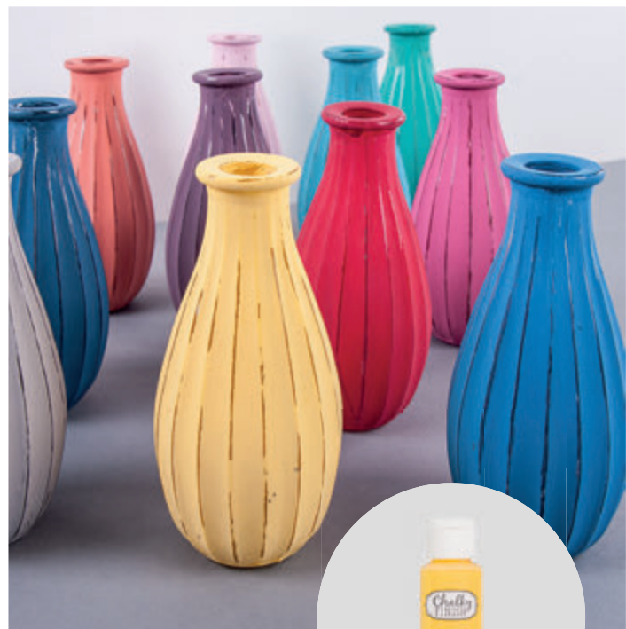
↑ Art. 38 866 ...