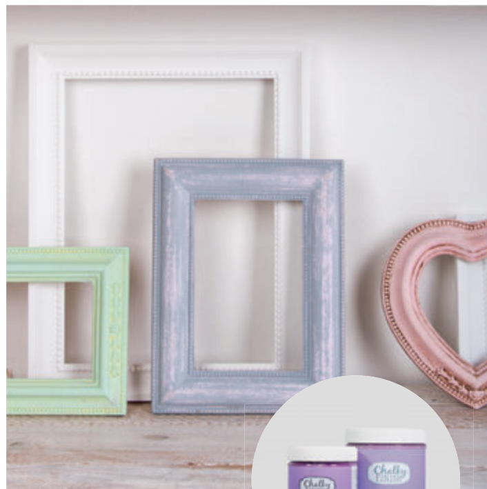
↑ Art. 38 867 ... + 38 868 ...