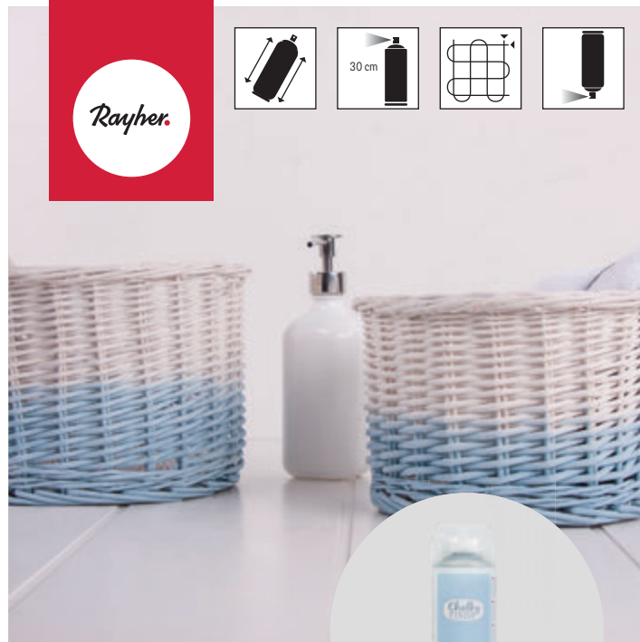
↑ Art. 34 371 ...