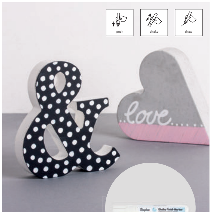
↑ Art. 35 017 ...